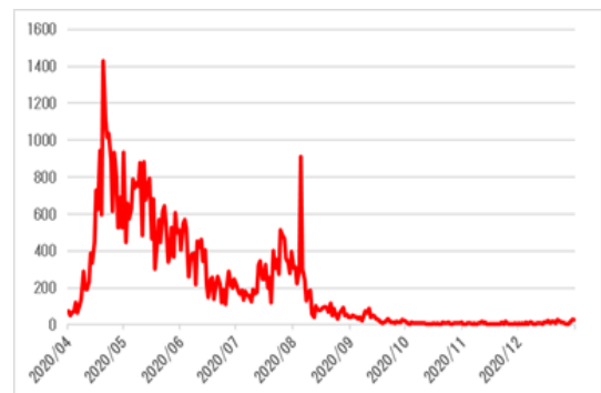
【シンガポール感染者推移(単位:人)】

年明け1月8日には、リー・シェンロン首相が新型コロナウイルスのワクチン接種を受けました。本年末までには全居住者が接種を受けられる見込みが立ち、普段の生活に戻れるとの期待感が高まっている状況です。