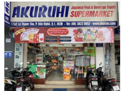
日本製品専門のミニスーパー（筆者撮影）

コロナ禍で変化した消費者の嗜好を捉えて、より便利でより高品質なものを提供する店舗が増えていくと思います。『Made in Japan = 高品質』という