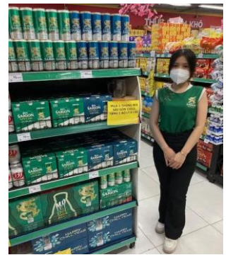
ビールメーカーのプロモーションガール

また店頭で商品をプロモーションする場合、日本と同様にメーカーが主導となって実施します。メーカー自身の営業スタッフを店頭配置したり、商品説明や広告を自社で作成したりする等、店舗スタッフに頼らずに商品をアピールする必要があります。