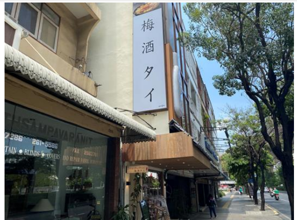
出店が増えている梅酒専門バー

日本からの輸入量が増えている品目の一つに梅酒があります。最近、梅酒専門バーがバンコク市内に数店舗オープンし、多くの若者が集まっています。健康的なイメージに加え、甘い味や香りがタイの若者に受け入れられているようです。