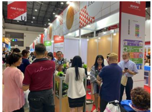
株式会社荻込様の出展ブース

2023年5月23日～27日にバンコク近郊で食品総合見本市「THAIFEX」が開催され、ジャパンパビリオンには前年比2倍となる33社・4団体が出展しました（2022年度は18社）。会場を視察した際、タイでは見かけないブランドで展開する牛肉やアルコール飲料などを出展するブースは、多くの来場者で賑わっていました。期間中には約7.8万人が来場し、他国のブースと比較しても日本企業のブースへの来場客が多く、日本食品の人気の高さを感じました。