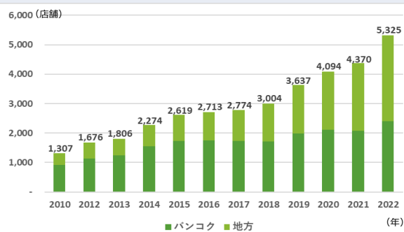
【図表1：日本食レストラン店舗数の推移】

現地での日本食の拡がりから、日本食レストラン数も右肩上がり増加を続け、2022年は5,325店舗と過去最多を更新しました。これまで新型コロナウイルス感染症に対する規制により、落込んでいたタイの外食文化ですが、規制緩和が断続的に行われていくなかで徐々に復活し、外食産業の事業環境は改善されていきました。これを受けて、日系企業による新規進出やフランチャイズ展開が行われた他、個人経営の店舗が増加したことも最多更新の背景となっています。また、日本食レストランの増加は、首都バンコクだけでなく地方都市でも見られ、流行の発信地であるバンコクでの日本食人気は、タイの地方都市に広がっていることがうかがえます。