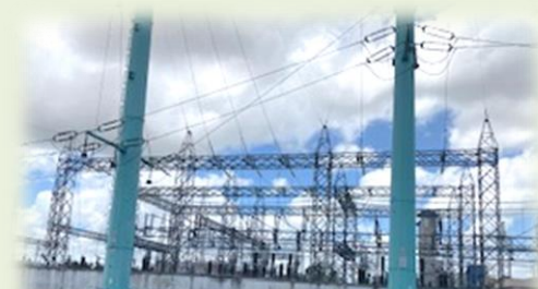
工業団地専用のインフラを完備しています

地方ならではの悩みとして、人材面を課題に挙げる企業の声もありました。経理・総務などのいわゆるホワイトワーカーについては、日本語スピーカーという条件で募集すると人材が集まらないため、大半の企業がホーチミン市で人材を採用し、工業団地まで出勤させています。省には、日本語教育を行う教育機関が少ないことから、地場の人材から日本語スピーカーを採用することは、現時点では難しいようです。