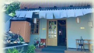
5月にブンタウ市初の日本人が握る寿司屋がオープンしました

ブンタウ市内に居住する駐在員によると、同市は観光地として発展してきた経緯から、外国人向けのレストランや住環境が整備されており、英語対応が可能な店舗も増えている、とのことでした。実際に筆者が訪問した際も、数は少ないものの日本食レストランや日本製品専門スーパーなどが営業しており、日本人にとって住みやすい環境が少しずつ整備されてきていると感じました。一方、実際に住むことを想定すると、医療施設が未発達であったり、ホーチミン市のように欲しいものがすぐに調達できるような環境にはないため、重視するポイントを整理して、居住地を選択する必要があると感じました。