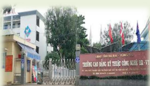
バリア・ブンタウ技術短大では多くの卒業生が地場の日系企業で働いています