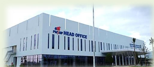
管理事務所に日本人が2名が在籍しています

また、同工業団地では、省内の日系企業を集めて定期的に情報交換を行うなど、企業間の繋がりを意識したサポートを実施しています。情報収集の難しい地方だからこそ日系企業同士の繋がりを必要としている企業は多く、省内のほとんどの企業が集まりに参加しています。