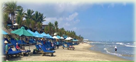
中心都市のブンタウ市には多くの観光客が訪れます

同工業団地に通勤する駐在員は、ホーチミン市に居住するか、同省中心都市のブンタウ市に居住するかの大きく2パターンに分かれます。ホーチミン市から工業団地までは、距離にして60km程度離れていることに加えて、出退勤のタイミングで渋滞に捕まりやすいこともあり、車で片道2時間以上かかることもあります。生産管理を行う駐在員は、トラブルなどの緊急時には工場に急行する必要があるため、より工業団地に近いブンタウ市内に住む人が多いようです。