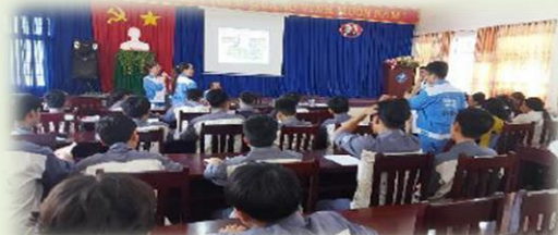
提携している地場の職業訓練校に、入居企業を紹介することで、採用のサポートを実施しています

その他の企業においても、優秀な人材が都市部に流出してしまうリスクを考慮して、一部の幹部社員に対しては、都市部と同じ水準の給与を支給するなど、都市部で事業運営をしている企業以上に、人材確保に気を遣っている様子が窺えました。