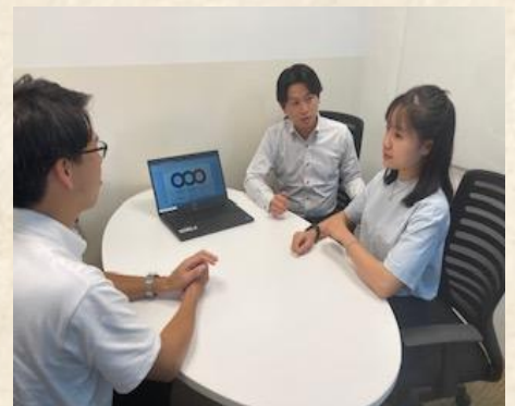
常陽銀行の出向者（右奥）が面談をサポートいたします。

ビジネスレベルで日本語対応可能なスタッフが多く在籍しており、日本人による徹底したマネジメントで、日本品質のサポートをご提供いたします。