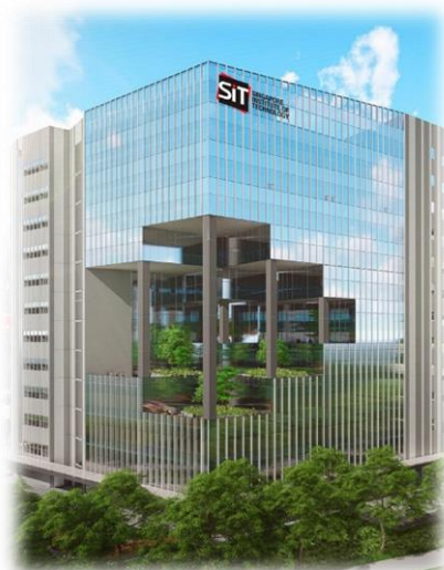
PDDイメージ写真一例

来年からの順次稼働に向け、着々と準備が進んでおり、PDDの今後の動向に注目です。