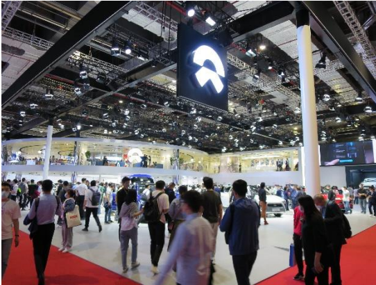
<多くの来場者で賑わう蔚来汽車パビリオン>