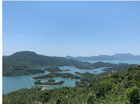
<千島湖清景台からの景色>

今回は、新界エリア西北部にある大欖郊野公園のハイキングコースを紹介いたします。ここは、道が整備され緩やかな登りが続くため、初心者でも歩きやすいコースです。今回私もチャレンジしましたが、ハイキングブームもあり、登山道は人出が多い印象を受けましたが、片道1時間半程度で、千島湖清景台へ到着し、大欖涌水塘（貯水池）を臨む絶景を目にすることができ、良いリフレッシュになりました。