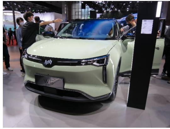
<新興 EV メーカー威馬汽車の人気 SUV「W6」>