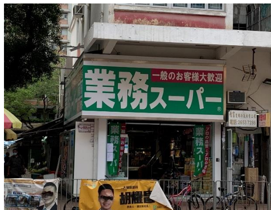
<業務スーパー香港1号店（筆者撮影）>

2021年5月に、神戸物産が運営する「業務スーパー」の香港1号店が開業しました。日本でも独自の商品展開で人気を集めていますが、香港でもこれまで紹介されていなかった日本産食品が提供されるのではと注目を集めています。日本産食品を扱う地元小売店が増加する中、他社との差別化を図っていくことが成功の鍵になると思われます。