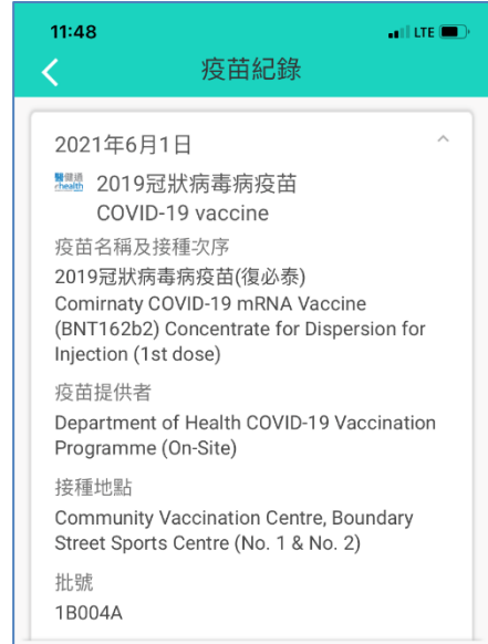
<スマホアプリ上のワクチン接種証明画面>

接種後には、ワクチン接種証明を、政府が開発したスマホアプリ「安心出行 (Leave Home Safe)」内で表示することができます。香港では、政府や経済団体がワクチン接種率を向上させるため、ワクチン接種者に対して、行動規制を一部緩和する施策や飲食店での割引など特典を設けていますが、自身のステータスをスマホで表示できるのは、非常に便利です。