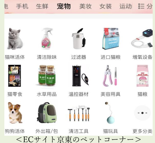
<ECサイト京東のペットコーナー>

ECサイトもペット関連商品の売れ行きに注目しています。2023年2月、EC大手アリババ系「天猫（Tmall）」は、同社ECサイトでペットフードの需要が過去7年間で急成長したとコメントし、注目分野の一つに位置づけています。また、京東（JD.com）のECサイトにおいても、販売額の増加とともにペット専用のコーナーが設置されるようになりました。ここではペットばかりか全ての関連グッズが購入できます。なかにはサブスクリプション型事業者も登場し、ペットフード、おやつ、栄養補助食品、ケア用品などの必要なアイテムが入ったボックスを会員向けに毎月配送するサービスが、人気を博しているケースもあります。