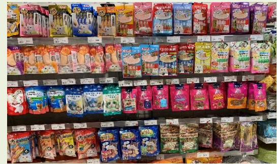
<日系スーパーのペットフードコーナー>

もともと中国のペット市場はベビー用品市場と酷似していると言われており、ベビー用品で日系企業は安全性、品質ともに高い評価を得ています。こうした背景もあり、日系企業による中国ペット市場への進出が相次いでいます。日用品大手ユニ・チャームは、江蘇省のペット用品企業と提携しペット用健康食品やトイレ用品などの販売を強化しているほか、家電大手パナソニックは、自動給餌器や給水器の販売を始めています。また、日系スーパーのペットコーナーには日系メーカーを含む数々のペットフードやペット用品が所狭しと並んでおり、激しい競争の様子が窺えます。