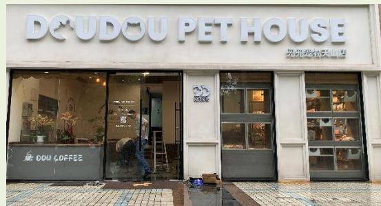
<喫茶店&ペットショップ>