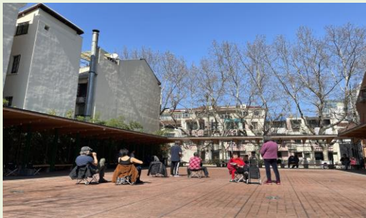
<ペットと飼い主の憩いの公園>

「2021年中国ペット消費動向白書」によると、中国のペット数は2010年に約6千万匹でしたが、2020年には約1億9千万匹と約3倍に膨れ上がっています。このうち、犬、猫の数だけで1億1千万匹（58%）にもなるそうです。ここ上海でも、スーパーに行けば当たり前のようにペットフードが売られ、街を歩けば動物病院、ペットショップ、ドックランに至る所で目にするなど、ペットとの共存環境は日本と全く変わらないものとなっています。増加した要因として、所得・生活水準が向上したことや単身者・高齢者世帯の増加により癒しを求めるようになったことが挙げられますが、この勢いは留まることなくさらに拡大していく見通しです。