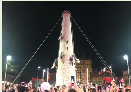
饅頭取りレース決勝戦の様子

香港の長州島は、中心地・中環（セントラル）からフェリーで30分ほどの場所に位置する小さな島です。そこで毎年5月に行われる「長州島饅頭祭り」は、数万人が訪れる人気と歴史のあるお祭りです。その起源は、18世紀に長州島で疫病が流行した際に、住民が神様へ厄払いのため饅頭を奉納したことが始まりと言われています。このお祭りでは、歴史上の人物に扮した子供たちが島内を練り歩くパレードなど様々な催し物が行われますが、中でも注目は、高さ十数メートルのタワーに付けられた9,000個の饅頭（現在はプラスチック製）を奪い合う饅頭取りレースです。より高い位置の饅頭は得点が高く、制限時間内に獲得した饅頭の合計得点を競うルールで、予選を勝ち抜いた12名で行われる決勝戦はTVで生中継も行われます。