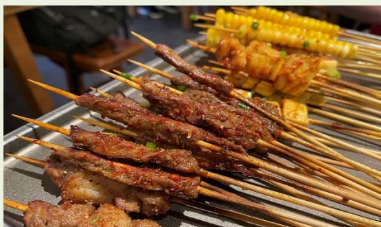
<串焼きの盛り合わせ>