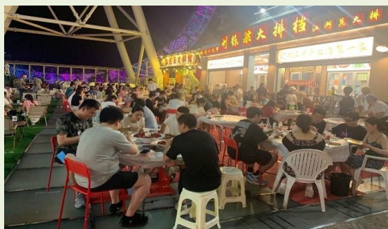
<賑やかな「大排档」の光景>

大排档で食べれば、解決できないことはないと言われています。上海の夏の夜、大排档で友達や家族と一緒に飲みながら、最高の気分を味わってください。（常陽銀行上海駐在員事務所 現地スタッフ 続蘇蘇）