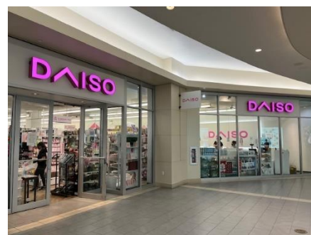
ニューヨーク近郊にも複数店舗