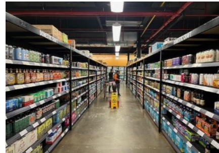
写真1 クラフトビールが並ぶ現地小売店