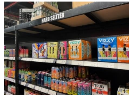
写真5 低アルコール商品が数多く並ぶ