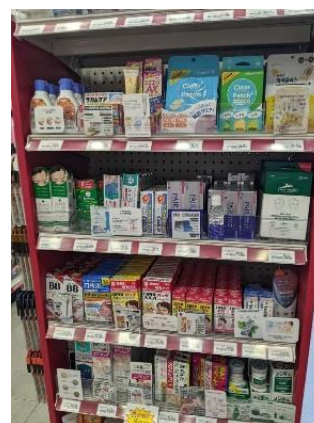
日本のお菓子や薬が揃う