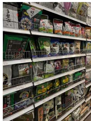
日本の商品を含め品ぞろえが豊富（海産物）

こうした米国でのアジア系小売販売網の拡大は、日本の食品生産者や製造業にとって、海外進出を検討する際の支援材料となる可能性があり、注目していきます。