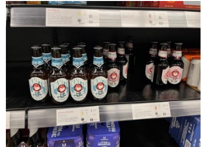
写真4 米酒販店に並ぶ Hitachino Nest Beer