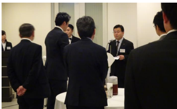
《鬼沢取締役の乾杯挨拶》