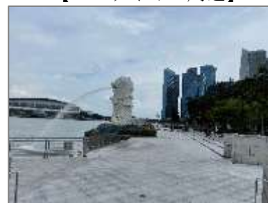
【マーライオン周辺】

国内の行動については規制を強める一方、入国制限については緩和の方向に進んでいます。10月2日には、日本を含む一部の国からの入国時の隔離期間を14日間から7日間に短縮するとの発表がありました。以前のような海外との往来ができるよう、今後さらなる入国制限の緩和が期待されています。