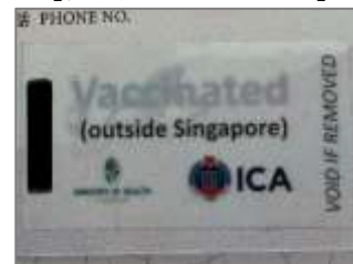
【証明となるシール】